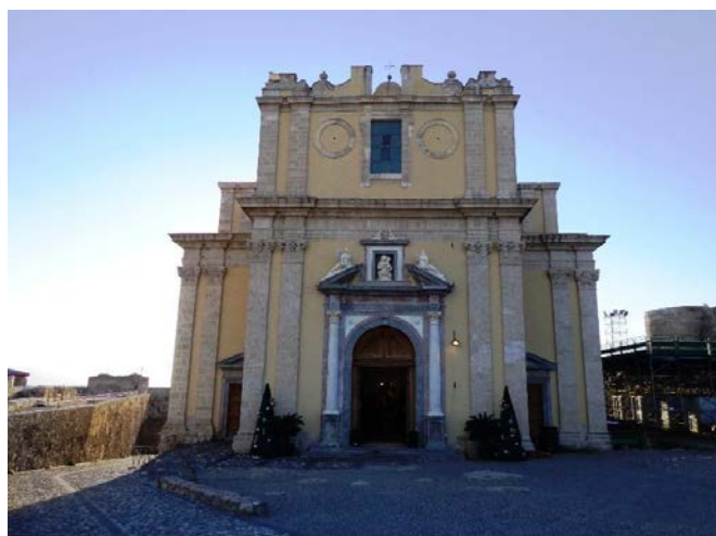
Figura 2: Duomo Vecchio.

Il Duomo Vecchio fu costruito a partire dal 1608, in sostituzione della precedente chiesa di S. Maria, sulla spianata dove sorgevano quattro chiese e tre costruzioni civili. Esso fu completato nella seconda metà del 1600. Durante il Settecento vennero eseguiti altri lavori, come la nuova sagrestia (completata nel 1704). Il Duomo fu intitolato inizialmente a S. Maria Assunta, e nel 1678 fu dedicato a Santo Stefano, patrono di Milazzo.