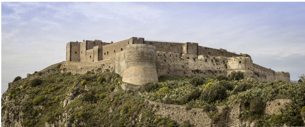
Complesso monumentale “Castello di Milazzo”

in questo documento troverete informazioni logistiche riguardo a: