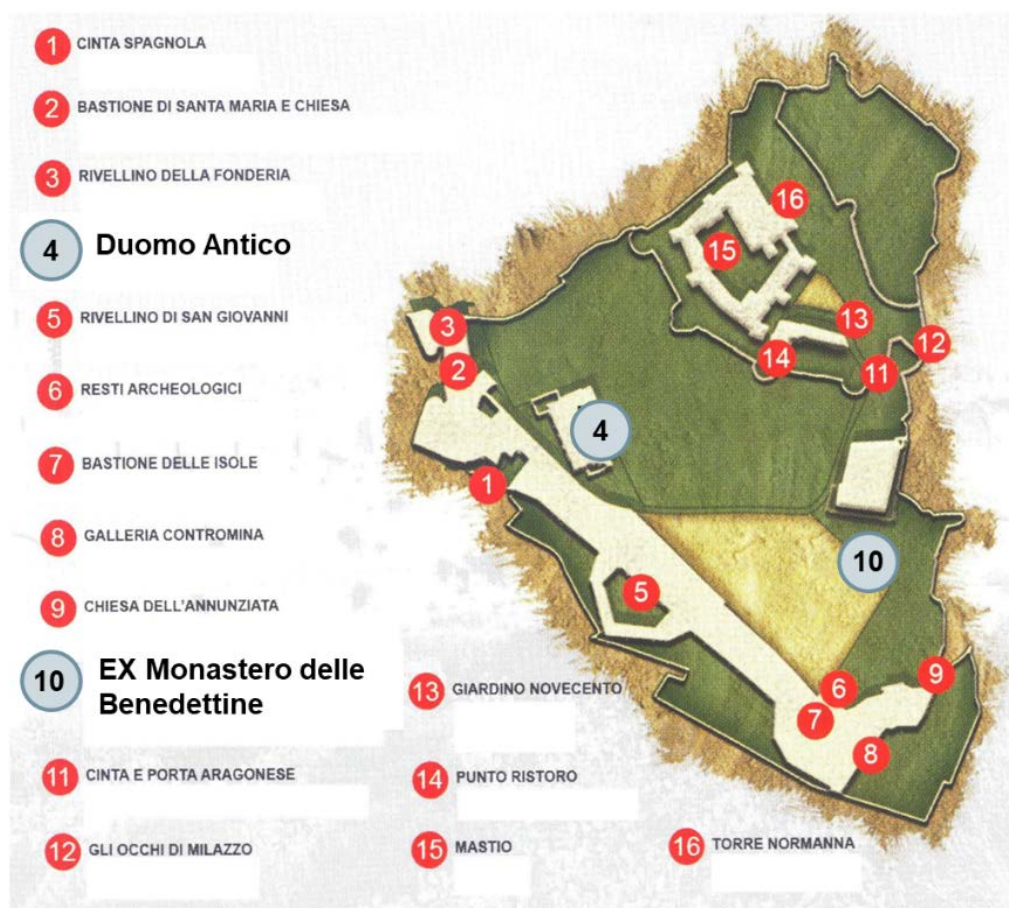
Figura 1: Pianta del Complesso monumentale “Castello di Milazzo”.

Di seguito sono riportate le informazioni principali relative alla struttura del Duomo Antico e del Monastero delle monache benedettine (evidenziate nella mappa riportata in Figura 1) dove si terranno le sessioni scientifiche del XIX convegno GIT nei giorni 16 e 17 Maggio 2025.