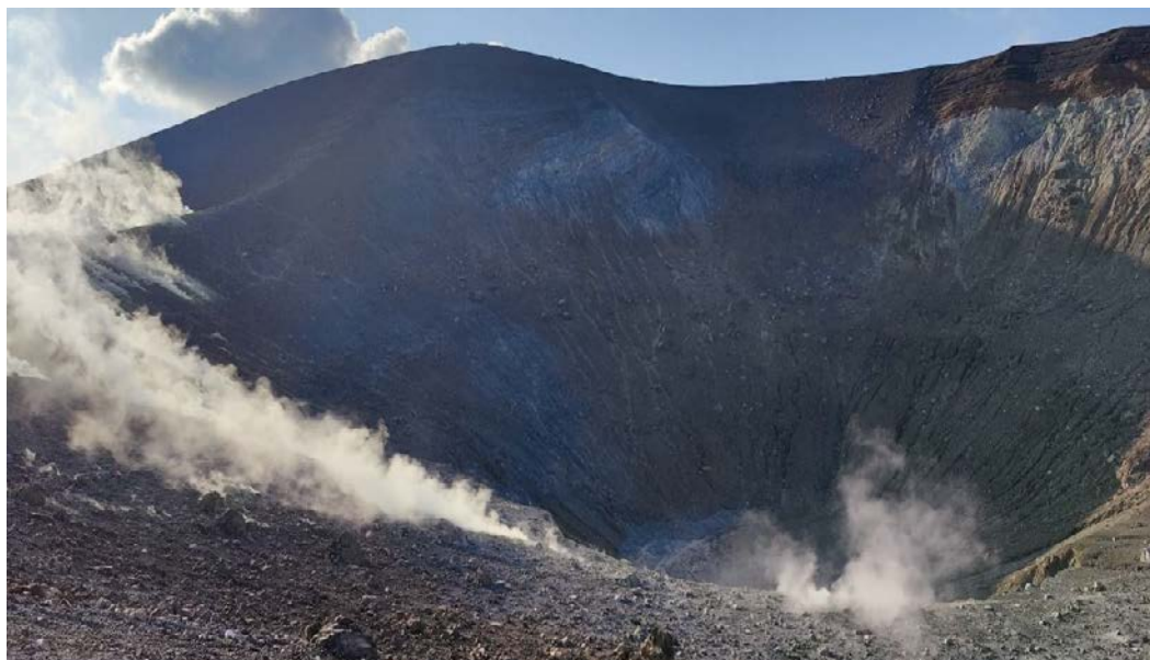
Figura 6: Cratere de “La Fossa”.

Il sentiero che porta in cima al cono de “La Fossa” si inerpica lungo il versante occidentale del cratere. Percorrendo il sentiero a passo lento, in circa 40 minuti si raggiungerà quota 250 m.s.l.m., dove è localizzato il campo fumarolico principale. Il percorso è contraddistinto da pendenze non molto elevate. Il fondo del sentiero è per lo più dissestato, ragion per cui si consiglia caldamente di calzare scarpe da trekking. Durante la salita sarà possibile osservare i prodotti vulcanici emessi dalle eruzioni degli ultimi 1000 anni circa. Si tratta principalmente di depositi piroclastici di fallout e di flusso. Sono presenti anche grandi blocchi di roccia emessi con violenza durante le eruzioni di tipo vulcaniano, le cosiddette bombe “a croste di pane”. Il campo fumarolico è caratterizzato da emissioni gassose ad alta temperatura ( >300^{\circ}\text{C} ), che mostrano elevati contenuti in \text{H}_2\text{O} vapore e \text{CO}_2 , con presenza minore di \text{H}_2\text{S} e \text{SO}_2 . Dal campo fumarolico principale ci si sposterà a quote più elevate percorrendo il periplo del cratere, per poi scendere giù a metà mattinata.