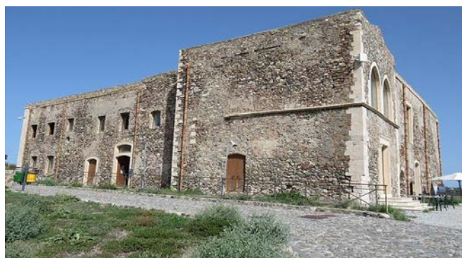
Figura 3: Ex Monastero delle monache benedettine del S. S. Salvatore

L'edificio conventuale, costruito nel corso di un ventennio a partire dal 1616, ha preso il posto di preesistenti fabbricati dei quali si ignora la destinazione, ma importanti a giudicare dalle numerose e ampie cisterne scavate nel sottosuolo. Un palazzetto quattrocentesco, rivolto a levante, è stato annesso alla struttura del convento e trasformato in cappella.