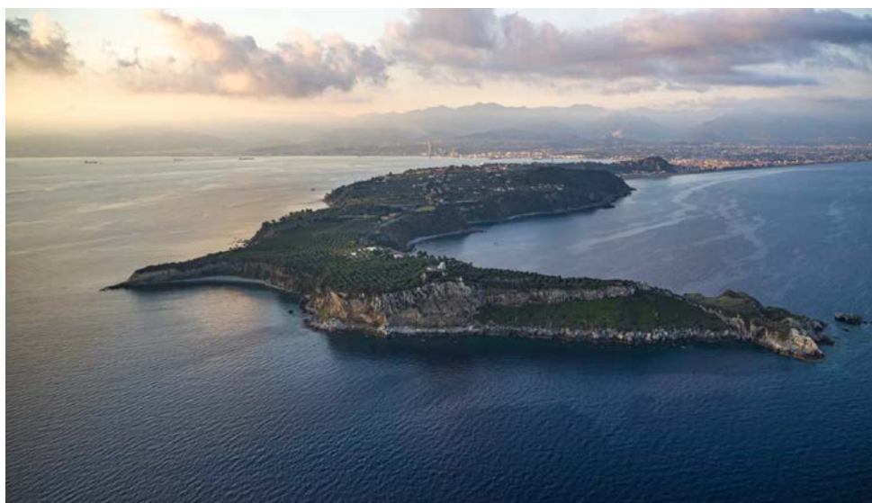
Figura 4: Vista di Capo Milazzo.

Il primo field-trip programmato per il giorno 15 giugno , sarà curato in collaborazione con il Consorzio di Gestione dell' Area Marina Protetta (AMP) di Capo Milazzo . Il Consorzio è composto dal Comune di Milazzo, dall'Università degli Studi di Messina e dall'Associazione Ambientalista Marevivo onlus. L'Area Marina Protetta Capo Milazzo, istituita nel marzo del 2019, è un'area che racchiude, nel suo perimetro, una varietà di paesaggi, scogliere a strapiombo sul mare, spiagge incantevoli con tramonti mozzafiato.